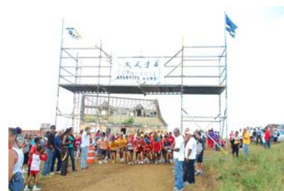
Salida di un di e hopi karedanan.