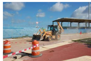
Un bista riba e trabounan di renobashon di e pista di SDK

"All dreams can come true, if you have the courage to pursue them"